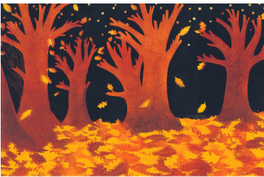
© P. Kalioujny - planche extraite de «MON BEAU SAPIÏN». Seuil Jeunesse - France 2022