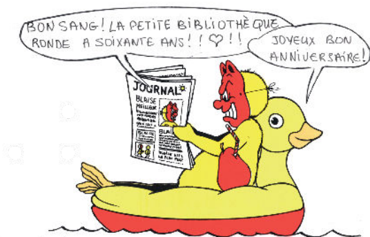
Illustration de Claude Ponti pour La Petite Bibliothèque Ronde

Quand les pratiques d'hier racontent celles d'aujourd'hui, nous évoquerons l'art et la manière de concevoir des projets qui mettent en lumière la littérature de jeunesse et ceux qui la font.