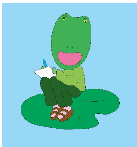
Illustration de Loïc Froissart pour La Petite Bibliothèque Ronde

Il abordera son parcours et ses projets passés pour évoquer le lien entre l'enfant et le design. Amine évoquera aussi le projet La Cueillette qu'il imagine pour La Petite Bibliothèque Ronde un dispositif qui questionne la notion d'espace de lecture.